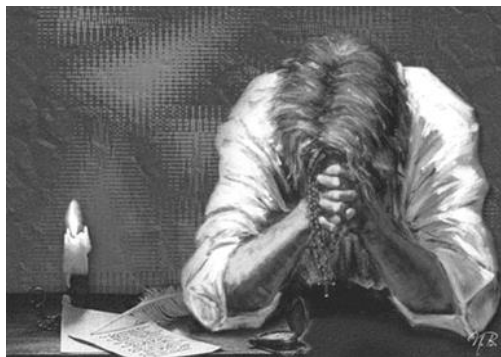
„Postul smerește trupul, privegherea curăță mintea, rugăciunea unește cu Dumnezeu.” (Sfânta Singilitichia)

maș, nu este om, ci doar arată o nălucă de om, și nu trăiește, ci doar arată o nălucă de viață, iar de fapt este mort, sau mai bine zis omorâtor, față de omul cel adevărat. Ni se pare și nouă, persoanei noastre, că ar trebui să stăm de partea omului drept, întâi-zidit; dar nu se știe ce s-a întâmplat cu noi de ne-am îndepărtat de ea și am trecut de partea omului venetic, pățimaș, până la a ne identifica cu el.