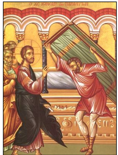
(Sfânta Evanghelie după Ioan 5, 1-15)

Atunci omul a plecat și a spus iudeilor că Iisus este cel ce l-a făcut sănătos.